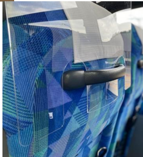
※使用イメージ画像