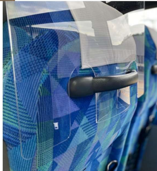
※使用イメージ画像